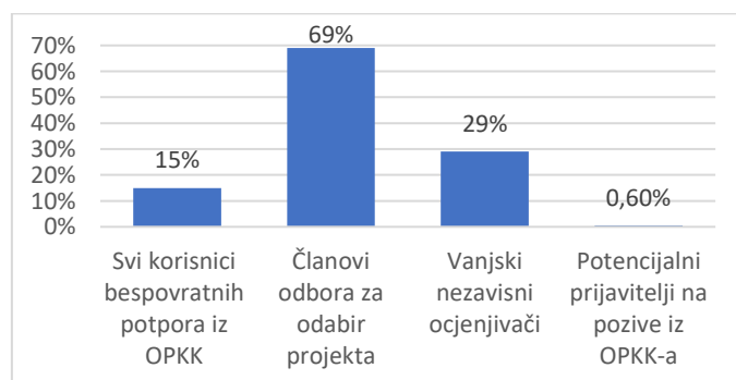
Grafikon 1. Raspodjela prikupljenih odgovora na ankete prema kategoriji ispitanika